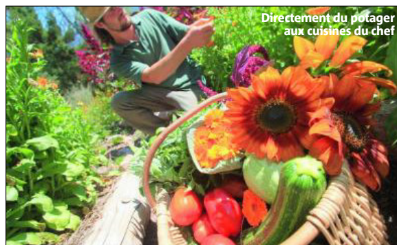
Directement du potager aux cuisines du chef

Le matin, lever entre 4 et 5 heures du matin pour profiter des légumes fraîchement cueillis du potager de l'arbooretum de Roure et de la production bio de Chez Alvarez à Bérol.